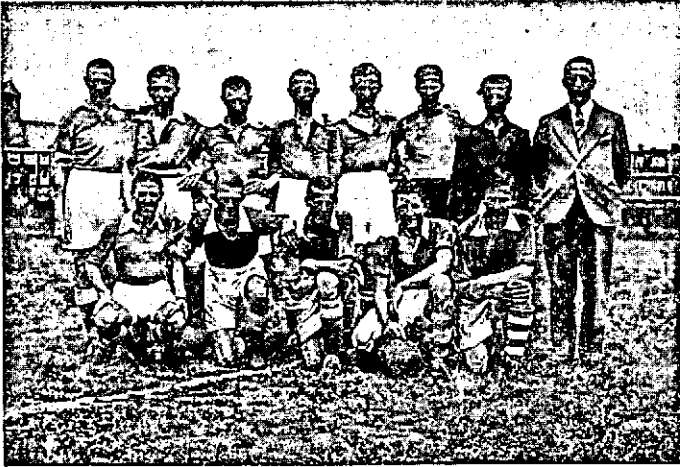
LENIG EN SNEL A , kampioen van afdeling 1c, tevens districts-kampioen van de D.H.V.B. in het district Den Haag.